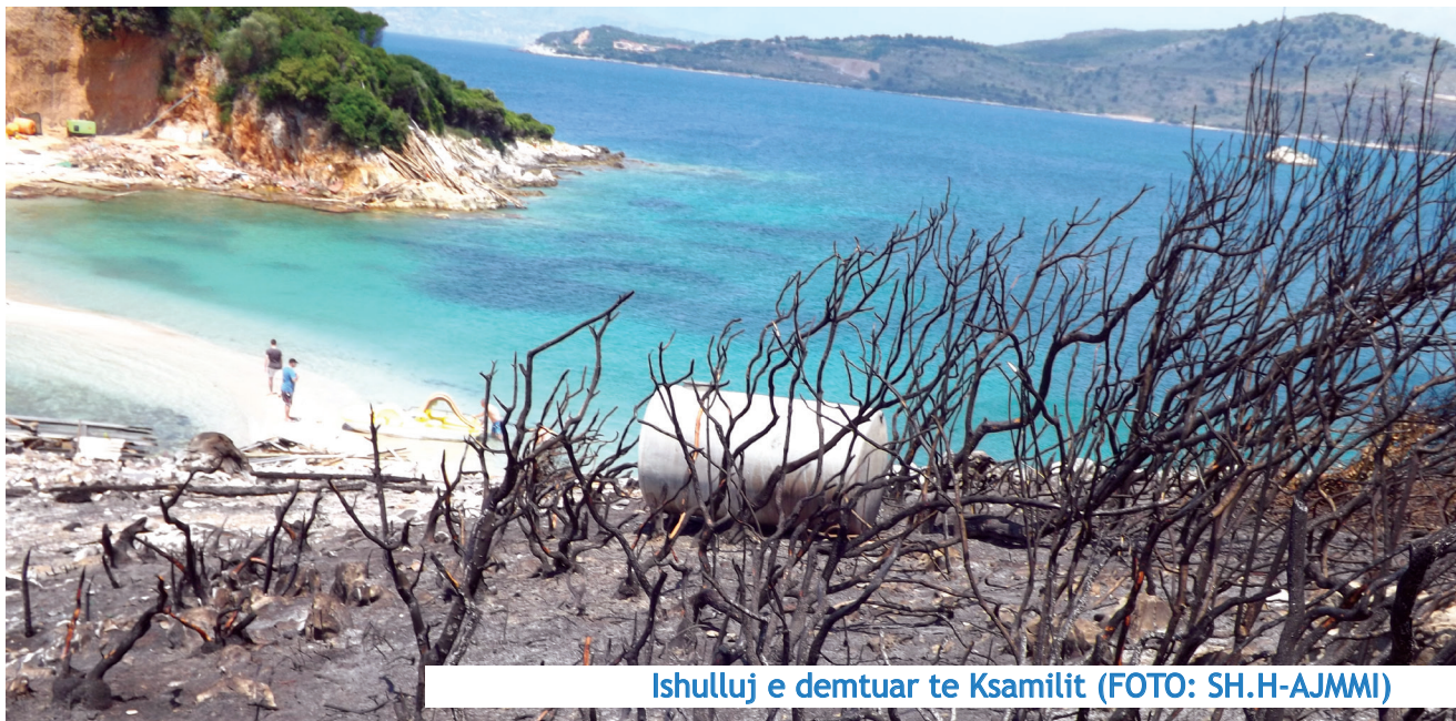
Ishulluj e demtuar te Ksamilit