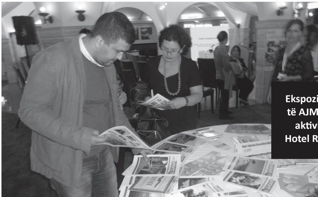
Ekspozite e botimeve të AJMMI-t gjatë një aktiviteti të REC, Hotel ROGNER Tiranë